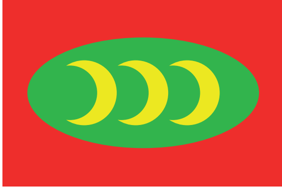
علم السلطان محمد الأحمر ذو الدائرة الخضراء.

فيما يظهر لنا أصلاً للهِلال العثماني كما يقول أصحاب هذا الرأي، بل الذي نرجّحه استنتاجاً من الروايتين أن الهلال كان شعاراً للملكة الشرقية كما كان شعاراً للسلجوقيين والعثمانيين. فلما فتح هؤلاء القسطنطينية استنتج المؤرخون بعدهم من توافق الشعارين ما نشأ عنه الرأي الأول. وسيبقى هذا الإشكال بلا حلّ حتى يهتدي الباحثون إلى نصّ صريحٍ لثقةٍ من معاصري الفتح.