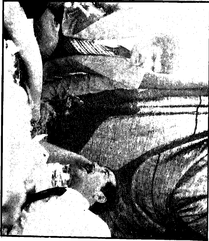
* صدام حسين يسأل المؤلف عن النتائج التي يمكن أن يسفر عنها إنهاء اتفاقية الجزائر * اخذت الصورة يوم ١٣/٢/١٩٧٩ . * عربياً، ١٩٧٥ .