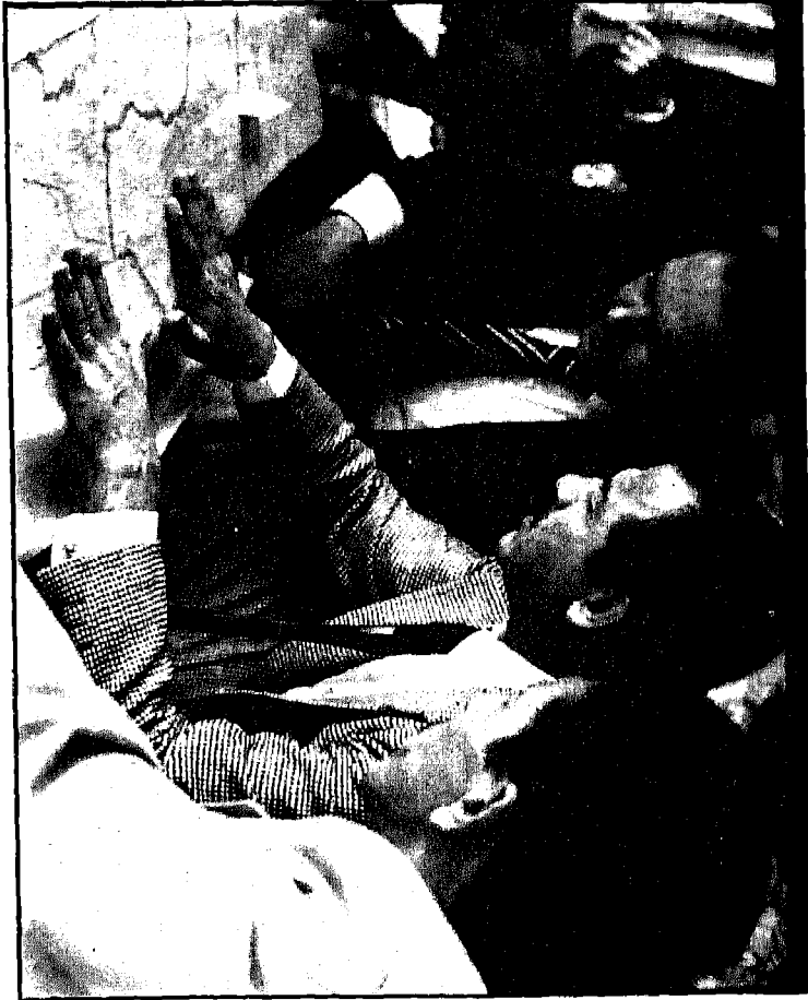
• صدام حسين يسأل: أية منطقة هشة عسكرياً يمكن الاستيلاء بسهولة منها إلى إيران. • اخذت الصورة على الحدود العراقية الإيرانية بتاريخ ١٤/٢/١٩٧٩.