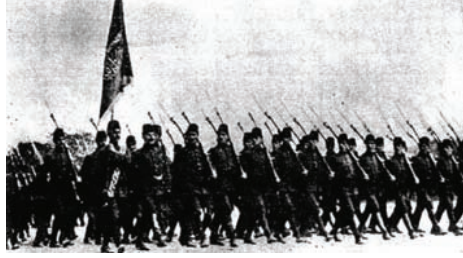
الهلال العثماني في أدرنه.