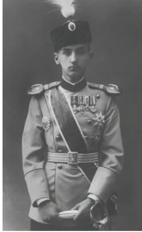
ولي عهد الصرب الحالي.