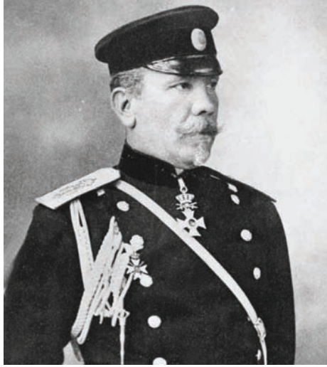
الجنرال سافوف القائد العام لجيش البلغار.