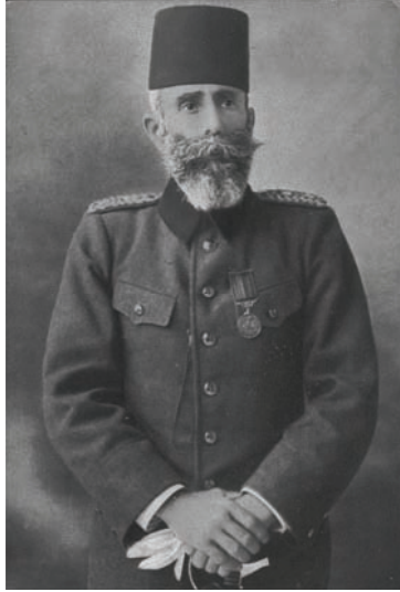
محمود شوكت باشا الاتحادي الذي خلف كامل باشا بعد حادثه الأستانة.