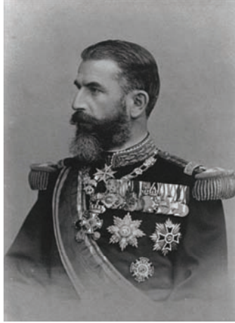
كارل ملك رومانيا التي تهددت بلغاريا بالحرب وأخذت منها سلستريا بدل حيادها.