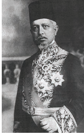
البرنس سعيد حليم باشا الذي عُين وزيرًا للخارجية بعد سقوط وزارة كامل باشا.

الحرب، وكانت الدول العظمى من جهة أخرى تنتظر من وزارة شوكت باشا جوابًا على المذكرة التي بعثت بها في عهد وزارة كامل باشا. وبعد أيام قليلة أرسل الأمير سعيد باشا حليم الذي عين وزيرًا للخارجية جوابًا إلى الدول قال فيه: «إن الحكومة العثمانية تطلب قسمة أدرنه إلى قسمين: قسم يأخذه البلغار وهو الذي يشتمل على الحصون والمعقل، وقسم يبقى لتركيا وهو المشتمل على المساجد والقبور السلطانية.»