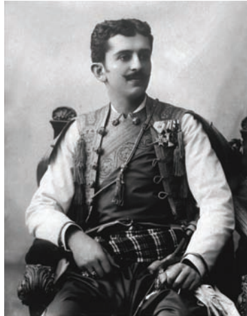
ولي عهد الجبل الأسود الحالي.