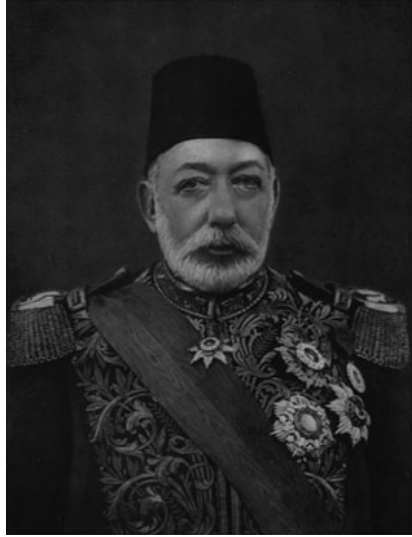
جلالة السلطان محمد الخامس.