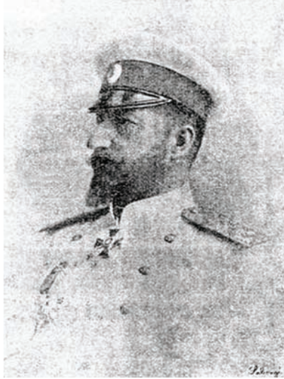
فردينان ملك البلغار.