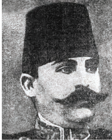
أسعد باشا قائد حامية أشقودره الذي نودي به ملكًا في بعض مدن ألبانيا.