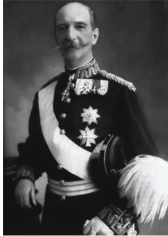
جورج الأول ملك اليونان الذي قُتل في سلانيك.