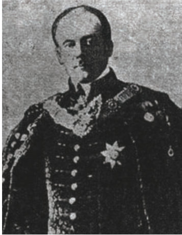
الكونت برشتول وزير خارجية النمسا الذي أصرَّ على طلب استقلال ألبانيا فوافقته الدول.