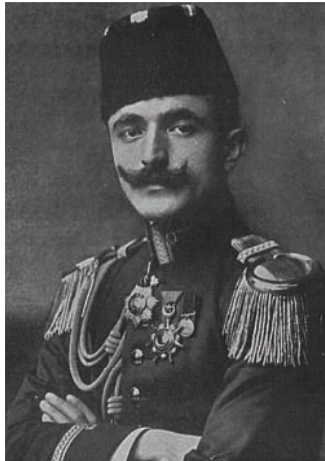
أنور بك الذي قلب وزارة كامل باشا.