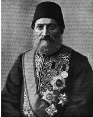
كامل باشا الذي خلف مختار باشا بعد كارثة قرق كليسا.