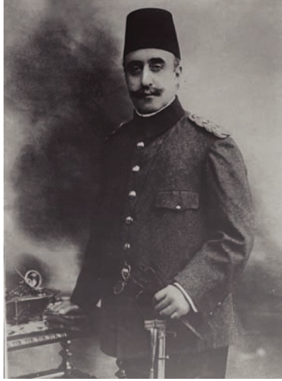
الأمير يوسف عز الدين أفندي ولي عهد السلطنة العثمانية.