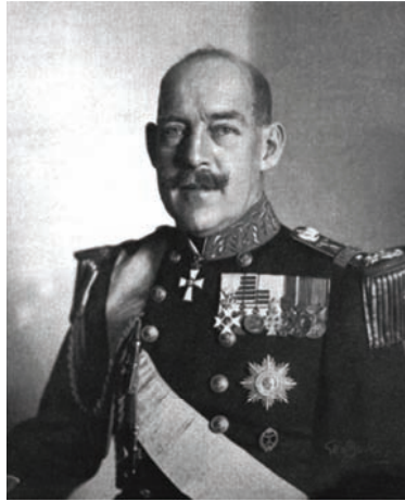
الأمير قسطنطين ولي عهد اليونان الذي صار ملكًا بعد مقتل أبيه.