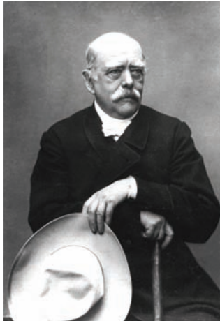
بسمارك رئيس مؤتمر برلين.