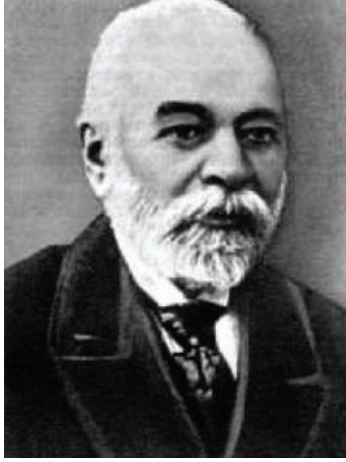
إسماعيل كمال بك رئيس الحكومة الألبانية المؤقتة.