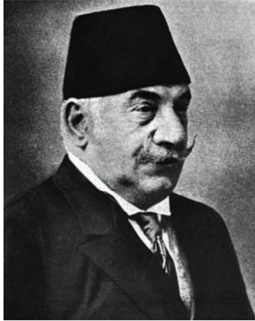
ناظم باشا الذي كان وزيراً للحربية وقتل يوم إسقاط وزارة كامل باشا.