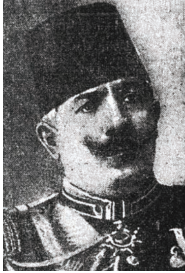
عزت باشا الذي تولى القساة العامة بعد مقتل ناظم باشا.

وفافوضني في الحالة العامة، وما تمكنت من مغادرة الباب العالي إلا بعد نصف الليل بثلاث ساعات، وكان البرد شديداً قارساً، فأثر في صحتي وأصابتني حمى شديدة.