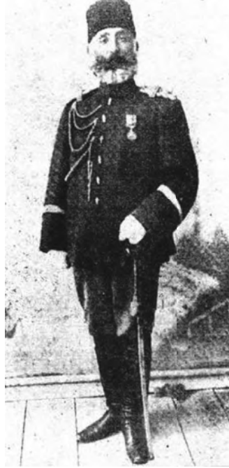
الغازي شكري باشا بطل أدرنه.

فقابل البلغاريون وسائر البلقانيين هذا الاستعداد السلمي بالسرور والارتياح، وعقد قواد البلغار وقواد العثمانيين هدنة شفوية، وسافر مندوبو الحكومات العثمانية والبلقانية إلى لندن للتوقيع على مقدمات الصلح طبقاً لما اقترحتة الدول، وهاك مُجمله؛ أولاً: أن يكون خط التحديد بين تركيا والبلغار ممثداً من إينوس إلى ميديا. كما قدمنا، ثانياً: أن تستقل ألبانيا كما قرر مؤتمر السفراء. ثالثاً: أن يفوض أمر الجزر في بحر إيجه إلى الدول العظمى، وأن تتنازل الدولة عن جميع حقوقها في جزيرة كريت.