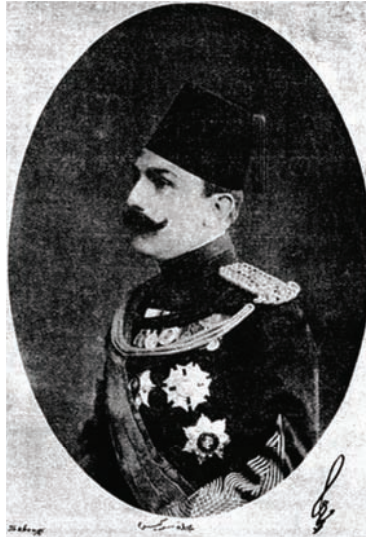
دولة الأمير محمد علي باشا (رئيس جمعية الهلال الأحمر).

وأهم من كل ما تقدم عند أهل الورع منهم ما قاله لنا أحد العلماء المسلمين وهو: «إن المسلم الذي تعلم قواعد دينه يعتقد أن وجود الخلافة واجب كل الوجوب، فلما حدثت معركة لوله بورغاز ثم زحف البلغاريون إلى باب الأستانة اهتز العالم الإسلامي لذاك النبأ الخطير؛ لأن كثيرين من أبنائه خافوا أن توضع مسألة الخلافة المقدسة على بساط البحث عند دخول الأعداء عاصمة السلطنة ومقر الخليفة، ولكن هذا الخوف كان في غير محله.» «أما قولهم: إن أوروبا عرفت بعد حرب البلقان أن الجامعة الإسلامية التي كان يهول بها عبد الحميد لا توجب خوف الدول، فهو قول يسرنا نحن المسلمين الذين ننظر إلى المستقبل؛ لأن أوروبا التي كبرت أوهاهما في هذا الموضوع كانت تظهر الخوف من نجاحنا واجتماعنا لإقلاق بالها، أما الآن فقد عرفت أن المسلم مثلاً يميل إلى أبناء دينه ميلاً طبيعياً كغيره، والمأمول بعد زوال هذا الشبح أن تترك أوروبا المسلمين يسرون في سبيل النجاح الطبيعي.»