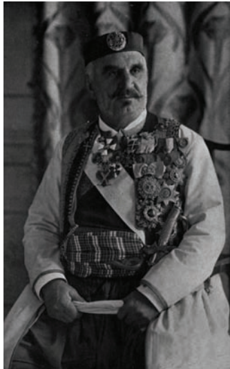
ملك الجبل الأسود.