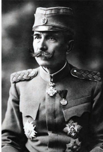
بطرس ملك الصرب.