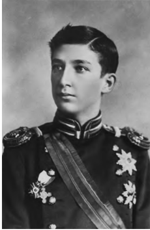
الأمير بوريس ولي عهد البلغار الحالي.