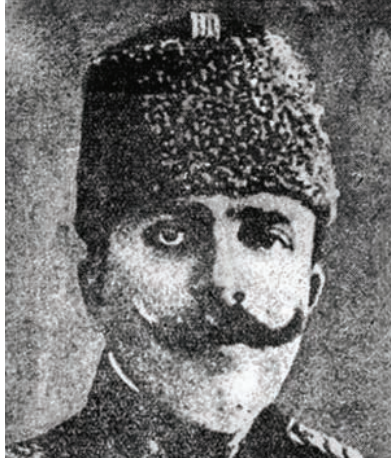
وهيب بك الذي تولى قيادة حامية يانينا.