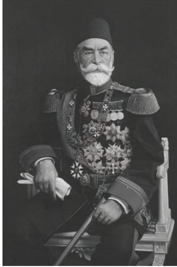
مختار باشا الغازي الذي كان صدرًا أعظم يوم إعلان الحرب.