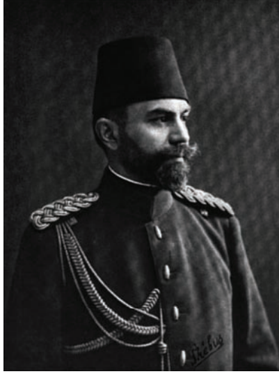
محمود مختار باشا الذي اشتهر بقيادة الفيلق الثالث وجرح في جتالجه.