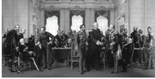
مؤتمر برلين وسري علاقته بالحرب.