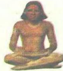
الهيئة المصرية العامة للكتاب

ويقول أيضاً: "لقد حاولت فقط أن أعطي فكرة واضحة بما فيه الكفاية عن حياة الطفل الصغير الذي تملك زمام أمرى".