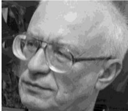
الكسندر ديميترييفتش كوفاليف**