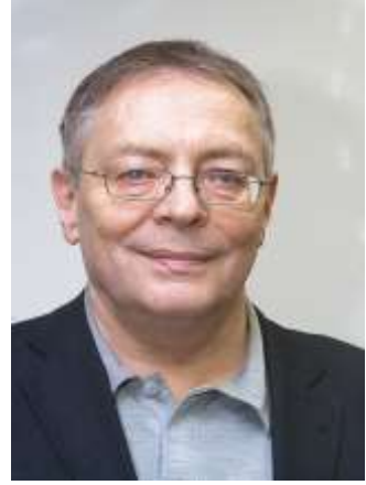
ليونيد غريغوريفيتش ايونين*

وُلد فريديناند تونيز عام 1855 في بلدة اولدنفورغ في دوقية شليسفيغ لدى عائلة فلاحية ميسورة. التحق عام 1872 بجامعة ستراسبورغ وأكمل دراسته الجامعية في توبينغن عام 1875 بأطروحته في علم اللغة الكلاسيكي.